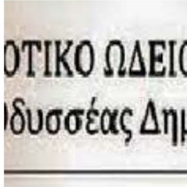
Δημοτικό Ωδείο Καλλιθέας "ΟΔΥΣΣΕΑΣ ΔΗΜΗΤΡΙΑΔΗΣ"

Το Δημοτικό Ωδείο Καλλιθέας «Οδυσσεύς Δημητριάδης» συνεχίζει την παροχή μουσικής εκπαίδευσης σε μικρούς και μεγάλους 26 χρόνια μετά την ίδρυσή του.