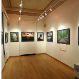
Δημοτική Πινακοθήκη Καλλιθέας «Σοφία Λασκαρίδου»

Η Δημοτική Πινακοθήκη Καλλιθέας αποτελεί ένα χώρο γεμάτο καλλιτεχνικά έργα που απεικονίζουν την αισθητική της ζωγράφου Σοφίας Λασκαρίδου.