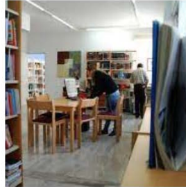
Δημοτική Βιβλιοθήκη Καλλιθέας

Η Δημοτική Βιβλιοθήκη Καλλιθέας ως ένας ουσιαστικός πυλώνας γνώσης και πολιτισμού στην περιοχή.